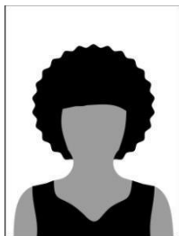
Figura 01 - Modelo de foto frontal